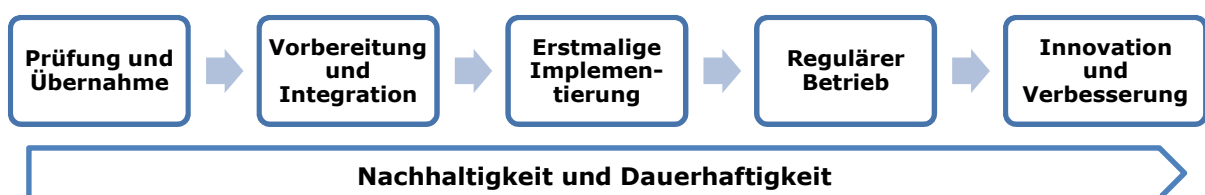
Abbildung 2: Phasen der Implementierung von Schulsozialarbeit - Modellverlauf

Für die Implementierung von Schulsozialarbeit ist es wichtig, von einem Veränderungs- und Entwicklungsprozess auszugehen, der einige Jahre in Anspruch nehmen kann (vgl. etwa Coulin-Kuglitsch, 2001; Bolay, Flad & Gutbrod, 2003). Die Inklusion möglichst aller HandlungspartnerInnen sowie sorgfältige Planung, Reflexion und Zielsetzung sind in jedem Fall die Eckpfeiler einer erfolgreichen Implementierung. Im Folgenden wird in Anlehnung an Fixsen et al. (2005) ein Phasenmodell (Abb. 2) für die Darstellung des Verlaufs der Implementierung von Schulsozialarbeit vorgestellt.