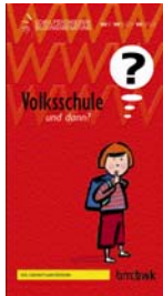
Folder „Volksschule – und dann?“