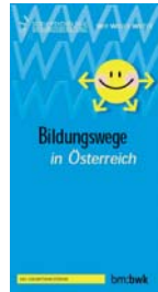
Folder „Bildungswege in Österreich“