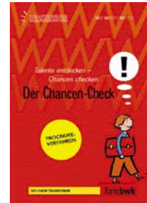
Broschüre „Chancen-Check“ (Hinweise für das Erkennen von Fördermöglichkeiten und Begabungen bei Kindern)